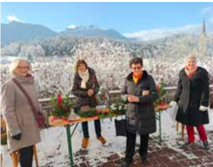
Die Adventsbasare der Frauenkreise Hermagor und Watschig waren wieder sehr erfolgreich!