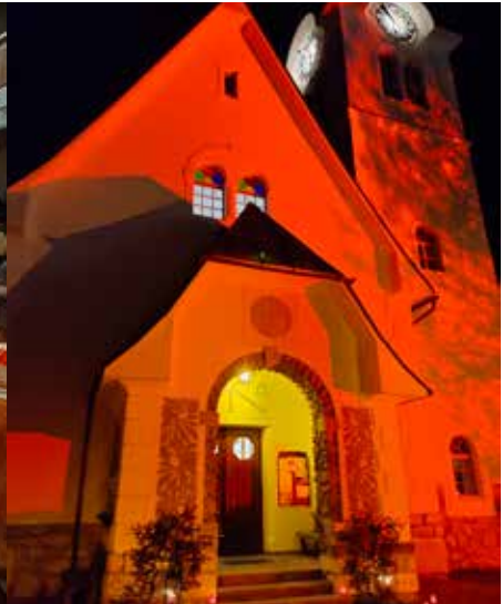
Die sehr bewegende ökumenische „Orange the World“-Andacht gegen Gewalt an Frauen.