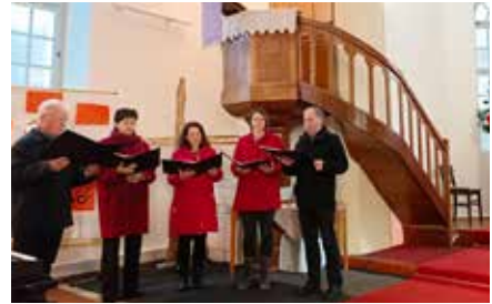
Die Nassfelder im Gottesdienst am 1. Advent