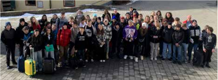
Das Konfirmandenwochenende am Rojachhof vom 19.-21.1. stand unter dem Motto „Identitris“