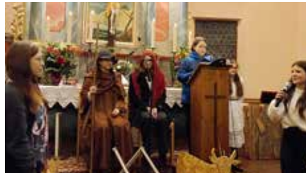
Das Krippenspiel der Konfirmanden/innen: Das Licht der Welt