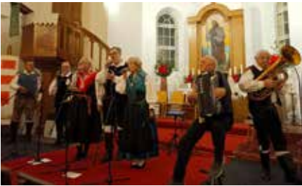
Das fantastische Konzert der Hauskapelle Arsenik in der Schneerosenkirche