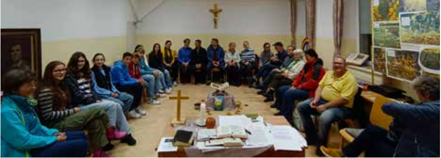
Die gut besuchte Bibelwoche zum Thema Schöpfung 1. Mose 1