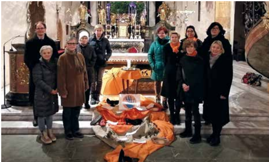
Orange the world- Ökumenische Andacht in der Kath. Stadtpfarrkirche am 30. November 2022 anlässlich des Internationalen Tages gegen Gewalt an Frauen

Evang. Pfarrgemeinde und Christlicher Missionsverband, Hermagor