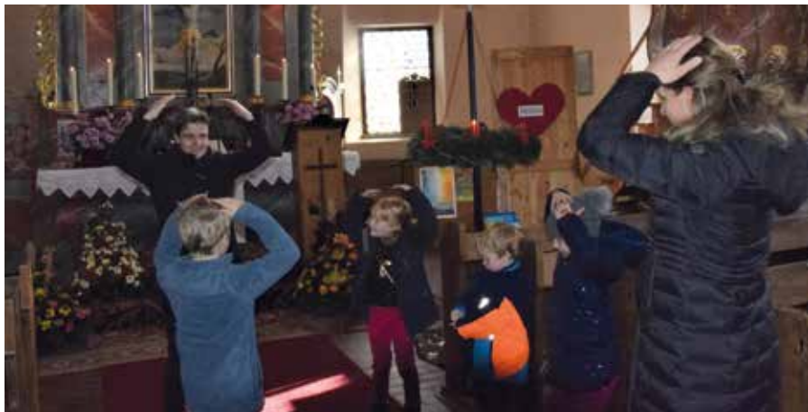
Unter dem Motto „Macht hoch die Tür, die Tor macht weit...“ standen die Familiengottesdienste am 1. Advent, den 27.12. zum Symbol der Türe und zur Frage, wer darin einziehen wird: Jesus, unser Herr und Heiland.