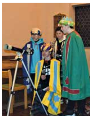
Die Konfirmanden und Konfirmandinnen haben uns mit ihrem Krippenspiel „Wir haben einen Stern gesehen“ gezeigt, wie die Weisen, die Sterndeuter aus Babylonien das Weihnachtsgeschehen erleben.

Viel Freude haben die Kinder regelmäßig bei der Kinderstunde in Watschig.